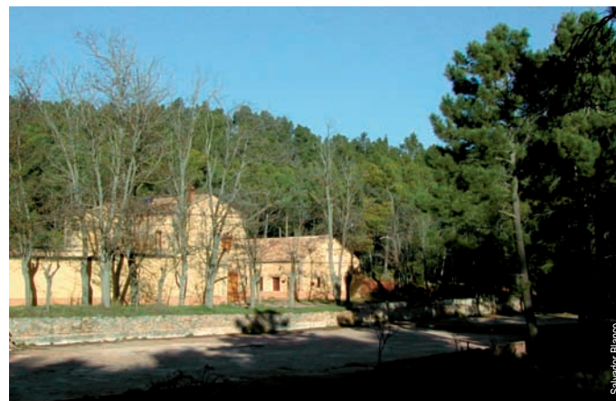
Refugio el Sequer, Benagéber